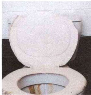
Foto 3: Lamentablemente el servicio de sanitarios muchas veces por el uso constante se van deteriorando constantemente en los accesorios internos como los externos.