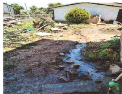
Foto 4: En esta imagen se presenta la corriente de agua a flor de tierra donde se estará construyendo una cuneta con parrilla para facilitar la limpieza de esta misma cuneta.