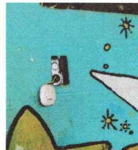
Foto 6: Es de suma urgencia la instalación de 9 tomacorrientes y 6 interruptores y 24 juegos de candelas u otro tipo de bombillas.

Observación: Si es necesario se pueden agregar hojas adicionales y actualizar el número de hojas.