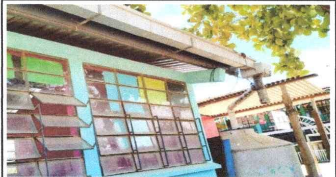
Foto 2: Con la presencia de la lluvia nos damos cuenta que la canalización ya que encuentra en ciertos desperfectos por lo cual debemos de canalizar el agua y depositarla para uso general del establecimiento.