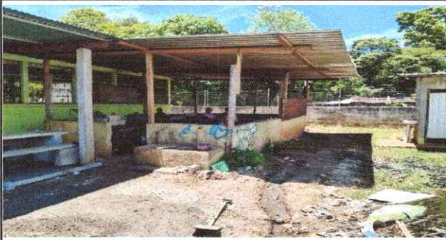
Foto 1: Implementar políticas, estrategias, planes de acción y proyectos para mejorar la alimentación escolar, por lo tanto basados en el renglon 20 vamos a reparar y sustituir la cocina escolar. (Comedor Escolar concluido con fondos propios, municipalidad y padres de familia).