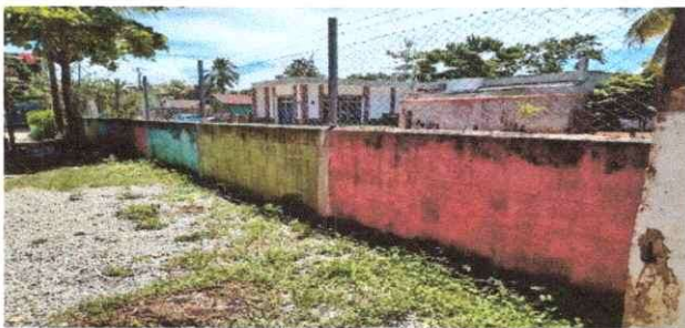
Foto 5: La presentación del muro perimetral es la presentación del establecimiento por lo tanto es importante mantenerlo bien pintado.